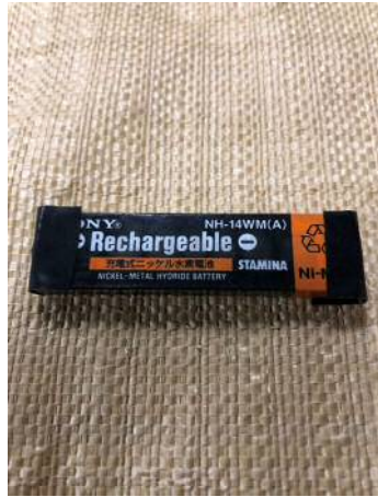
電極端子部の絶縁