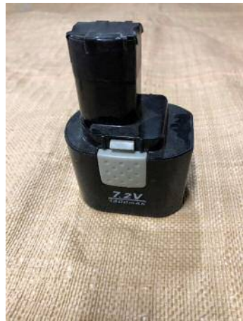
電極端子部の絶縁