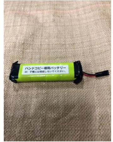
電極端子と配線部の絶縁