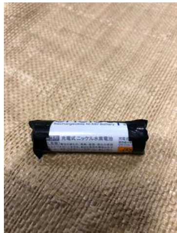
電極端子部の絶縁