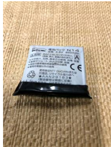
電極端子部の絶縁